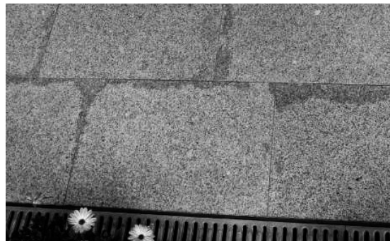
Feuchtrückstände (Abb. 1)

Bei Betonprodukten: Nach der anzuwendenden Norm für Platten aus Beton mit einer Kantenlänge bis zu 600 mm darf das Maß unter Umständen um bis zu +/- 2 mm abweichen (Plattenstärke +/- 3 mm). D.h., Platten aus Beton dürfen bis zu 6 mm Stärkendifferenz aufweisen.