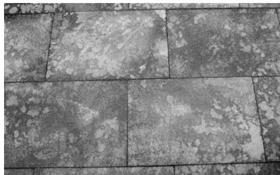
Flecken von Bindemittlrückständen (Abb. 3)

Die genannten Sachverhalte stellen somit keinen berechtigten Beanstandungsgrund dar.