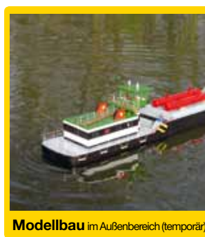
Modellbau im Außenbereich (temporär)